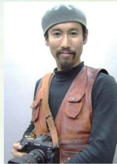
渡部 陽一 (プロフィール)

1972年静岡県富士市生まれ。明治学院大学法学部法律学科卒業。戦場の悲劇、そこで暮らす人々の生きた声に耳を傾け、極限の状況に立たされる家族の絆を見据える。