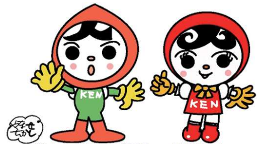
人KENまもる君 人KENあゆみちゃん 人権イメージキャラクター