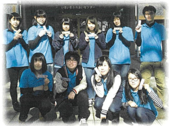
割り箸入れを作ってくれた『とんぼの会』の皆さん