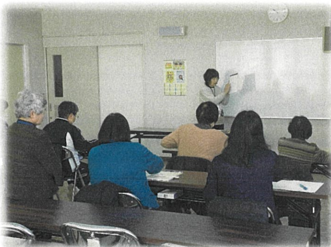
高秀代表による講座