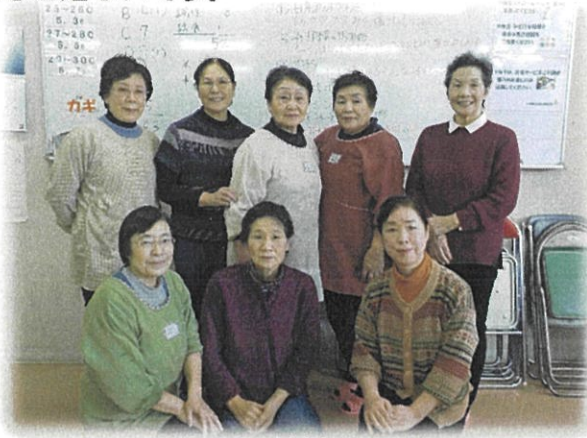
3月2日（金）当番の調理ボランティアの皆さん