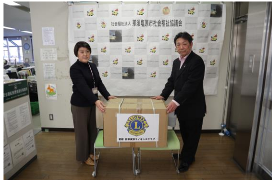
西那須野ライオンズクラブ 様