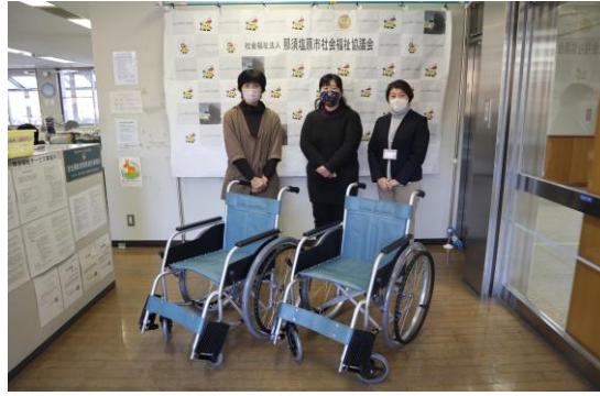
コーヒーカップ&虹の会 様