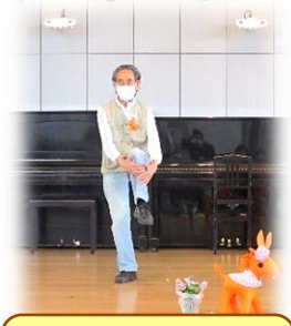
ボランティアさんによる体操指導