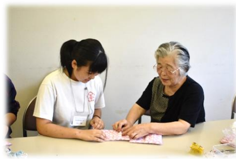
▲西那須野地区のサロンの様子