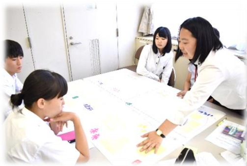
▲グループワークの様子