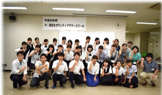
▲認知症サポーターの証 オレンジリングを付けて記念撮影

受講者からは、「認知症について学べたので、体験先で活かしたい。」「傾聴講座では聴くことの大切さを知った。」などの感想がありました。