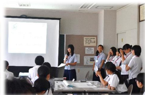
▲とんぼの会の紹介の様子