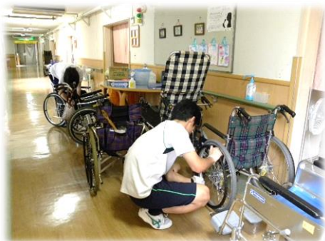
▲利用者様の車いすの清掃の様子