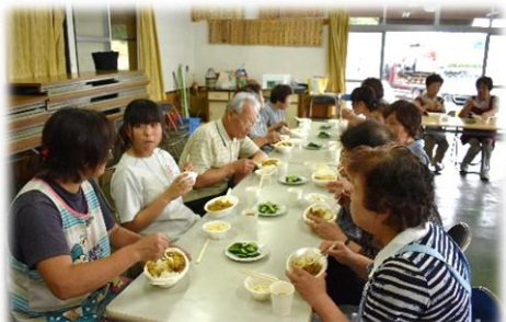
▲塩原地区のサロンの様子

参加者からは「地域でこのような活動が行われているとは知らなかった。もっと周りの人たちに知ってほしい。」「自分の住んでいる地域でおこなわれている活動があったら参加したい」などの感想がありました。