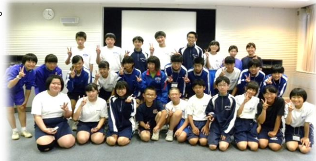
▲参加した中学生（29名）

開講式では、お互いに不安と緊張がありましたが、オリエンテーションでストロータワーを作成した時には、少し笑顔も見えて楽しくグループワークをすることができました。