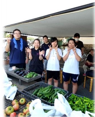
▲施設で採れた野菜の販売のお手伝いの様子