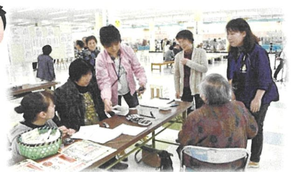
▲測定の結果を聞いている様子