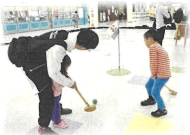
▲グラウンドゴルフに挑戦