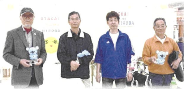
▲世界の広場のボランティア皆さんです

楽しみながら外国語を話そう！外国語に慣れよう！を目的に、国籍関係なくコミュニケーションができるブースです。紙芝居を英語で読み聞かせをし、子ども達が英語を身近に感じることができます。