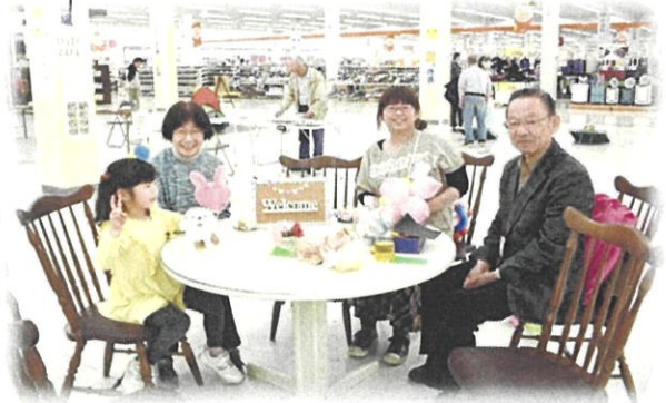
▲笑造カフェ 2 のボランティア皆さん

交流と言えばおしゃべりでしょう！をコンセプトに気軽に立ち寄りおしゃべりできるブースです。かわいい看板娘に会いに来てください(^_^)