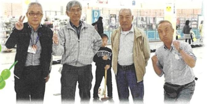
▲遊ぶ広場のボランティアの皆さん