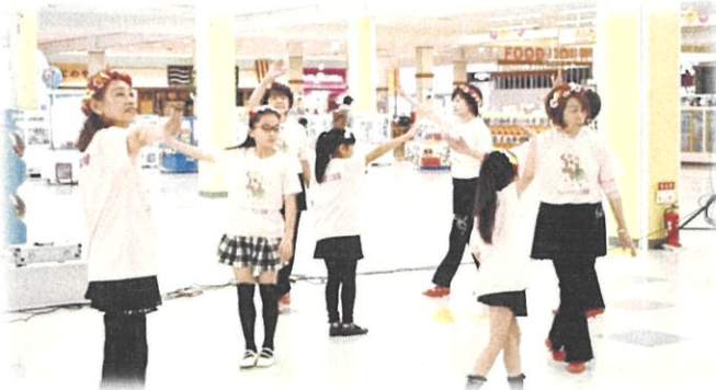
▲フォークダンス舞夢

今回のステージコーナーは、ボランティアセンター登録団体の3団体が協力してくださいました。見学している方と一緒に踊ったり、ゆったりとした音楽で和ませてくださったり、皆が笑顔になれるステージでした。ボランティア団体の普段の活動を知っていただける場にもなりました。