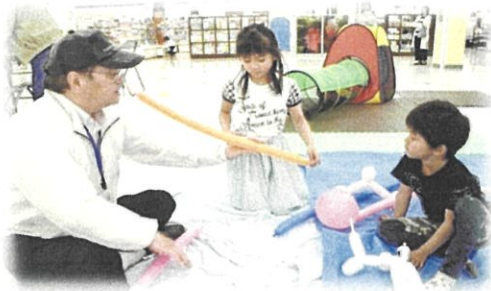
▲遊ぶ広場のメンバーとバルーンアート

グラウンドゴルフ・輪投げ・囲碁・将棋・バルーンアートなど一緒に楽しく遊ぶ体験型ブースです。参加した親子連れのお父さんは、「楽しかった、グラウンドゴルフを初めて経験しました。また機会があったら参加したい。」と話してくださいました。