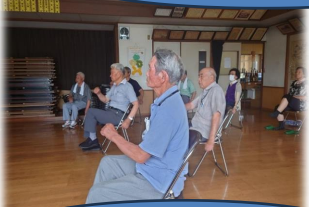
アンチフレイル体操、真剣です