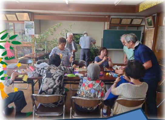
飾りを作り、短冊を書いています