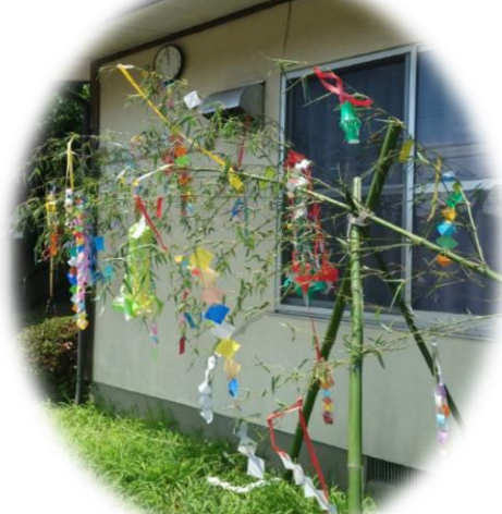
今年も立派な七夕飾り