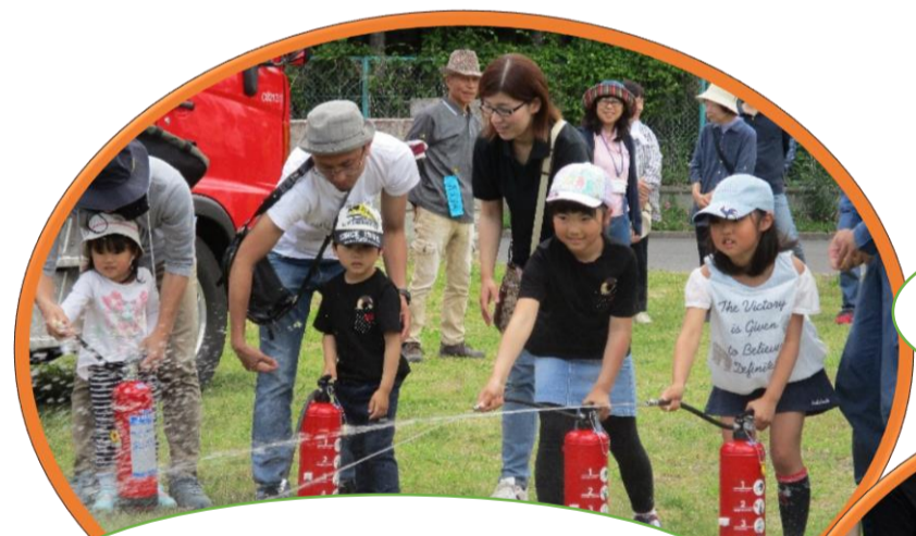
僕たちちびっ子消防団！

歩き終えたらバーベキューを行い、普段顔を合わせない方とコミュニケーションを取る機会となりました。地域住民同士、老若男女問わず交流を深めることができ笑顔が絶えない一日でした！