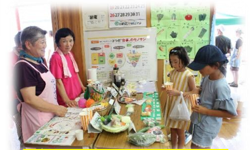
食生活改善推進員は地域の健 康づくりを推進しています！

西三島公民館まつり が行われ、沢山の住民の方 が参加！福祉バザー、模擬 店等大盛況でした！