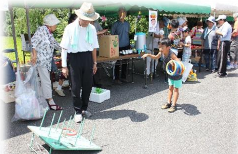
輪投げいくつ入るかな～？