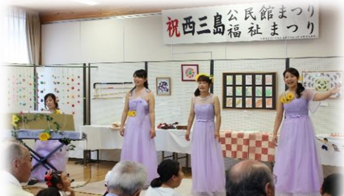
フェアリー ヴォーチェ・コンサート 素敵な歌声で聞き惚れます♪