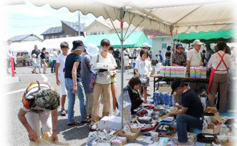
福祉バザーは掘り出し物がいっ ぱいです☆