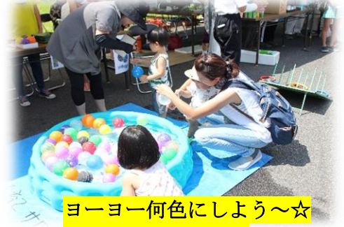
ヨーヨー何色にしよう～☆ 上手に釣れるかな！