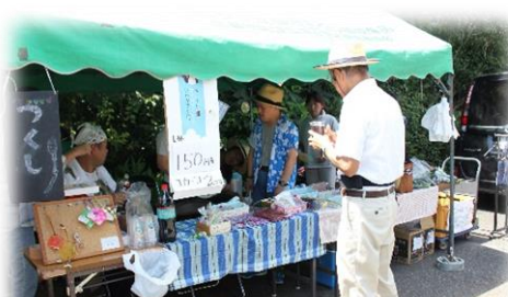
社会福祉協議会の「多機能型事 業所つくし」も出店しました♪