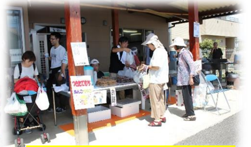
つきたてのお餅もとっても美味 しそうですね！