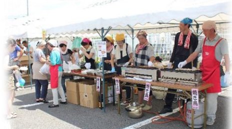
焼き鳥や焼きそばなどの模擬 店からはいい匂いが～！