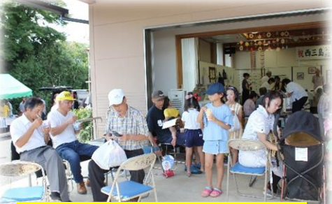
皆でワイワイ食べると一段と美 味しくて楽しいですね☆