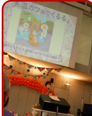
笑温カフェの紹介をする「エママとアッコママ