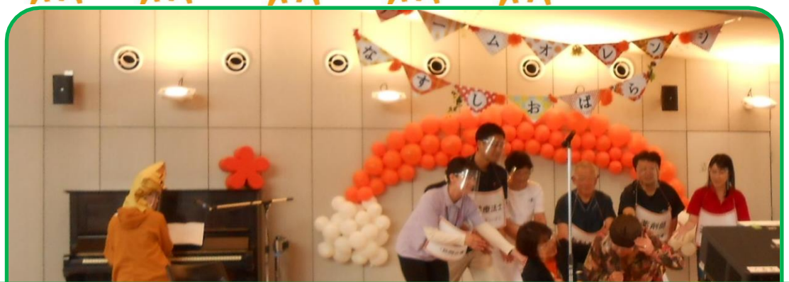
在宅医療・介護支援に取り組む医師や看護師らで構成する「劇団ざいたっく」による寸劇