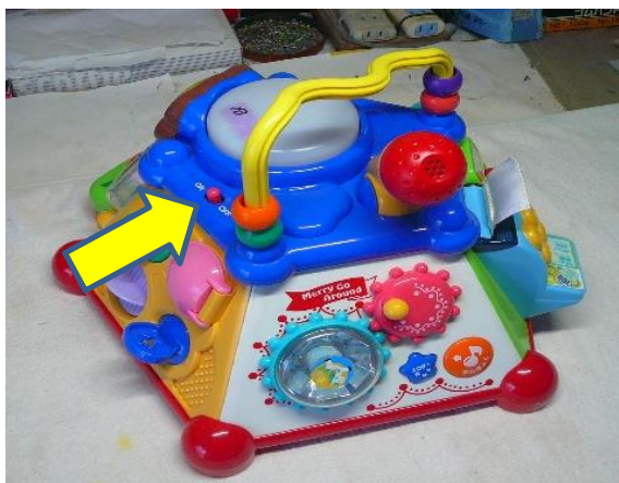
左上の赤いボタンが壊れたスライド型スイッチ