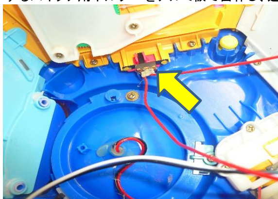
今までのスイッチの取付

内部を開けるとスイッチの固定方法が適切でなく、スイッチを構成する部品通しがお互いに噛みこんで、ための動きが悪くなっていました。思い切ってスイッチの固定方法を変えるため、新たにスイッチを固定するスイッチ用ホルダーをアルミ板で自作し、近くにあるネジ2か所でスイッチ固定しました。