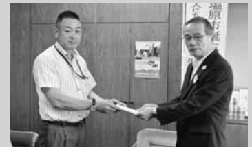
ブリヂストン栃木地区安全衛生協力会様