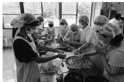
視覚障がい者との調理交流会

各体験場所でのふりかえりでは、体験前と体験後の気持ちの変化 や今後自分たちが出来る事などについて話し合いました。