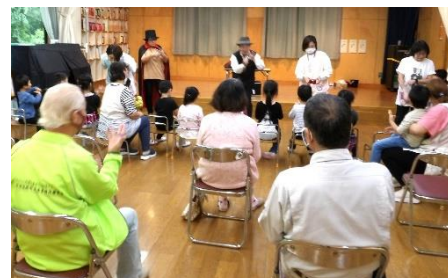
▲みんなでマジックに挑戦中！