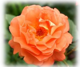
▲プリンセスミチコ