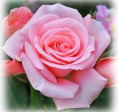
▲プリンセスアイコ

お花が好きな方、できる範囲で構いません。 一緒に素敵な那須塩原駅周辺を創ってまいりましょう。 お待ちしております♪