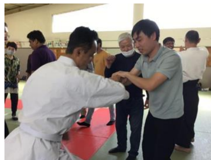
▲実技体験指導の様子②