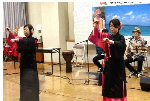
▲四つ竹を使った踊り