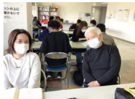
▲普段の教室の様子