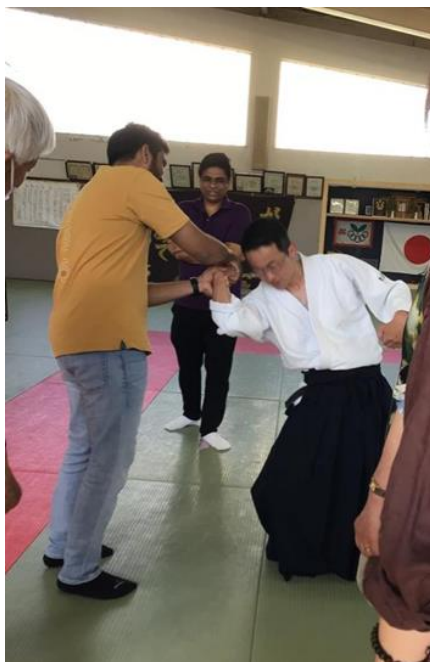
▲実技体験指導の様子①

演武を披露していただいた後、技をかけ合う参加型の指導を行っていただき、大に楽しみました。