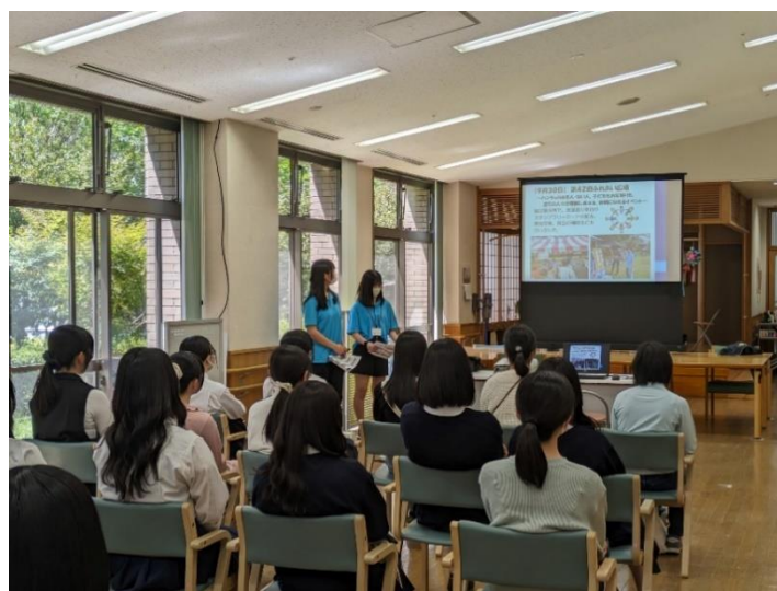
▲入会説明会の様子

4月28日（日）ボランティアセンターで、那須塩原市高校生ボランティアグループ「とんぼの会」の入会説明会を開催しました。今回、16名が新たに加入し、総勢32名のグループとなりました。とんぼの会は、高校生らしく、元気に明るく、様々な活動にチャレンジしていきます。とんぼの会に活動を依頼したい場合は、ボランティアセンターまでお問い合わせください。