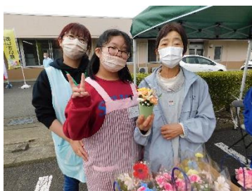
▲ブースで花の販売補助